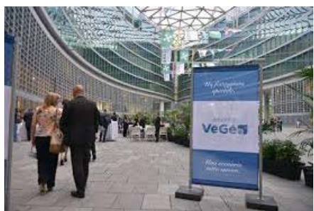
La rinascita di V&Gé nell'estate del 2014